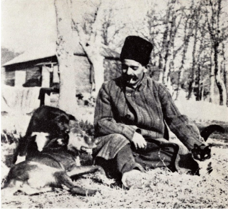
Gurdijev sa Filosom